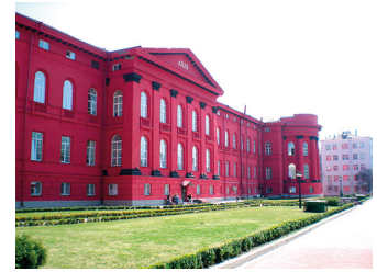
Рис. 1. Юрій Дуброва в останні роки життя (Lester, UK) — за вебсторінкою «Tribute to Yuri Dubrova, 1955–2023»). Вид на Лестерський університет (вгорі) і Київський університет (внизу); фото із всемережжя.