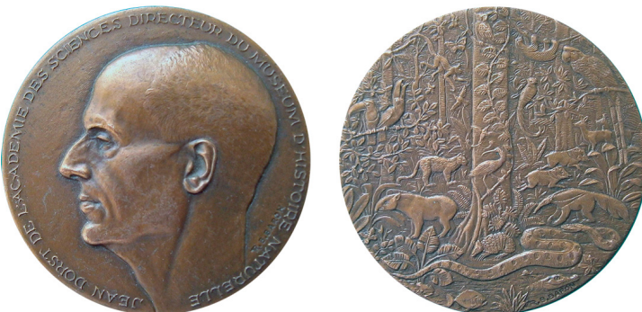
Рис. 25. Медаль на честь Жана Дорста. Аверс та реверс.

Fig. 24. Medal dedicated to Maurice Alfred Fontaine. Obverse and reverse.