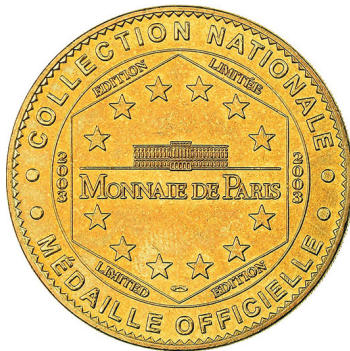
Рис. 32. Медаль, присвячена Звіринцю Саду рослин (2). Аверс та реверс.