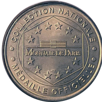
Рис. 31. Медаль, присвячена Звіринцю Саду рослин (1). Аверс та реверс.