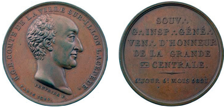
Рис. 15. Медаль, присвячена де Ласепеду. Аверс та реверс.

Fig. 14. Medal with the image of Louis Jean-Marie Daubenton. Obverse and reverse.