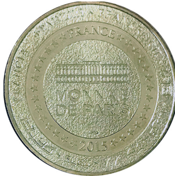
Рис. 34. Медаль, присвячена Венсенському зоопарку (2). Аверс та реверс.