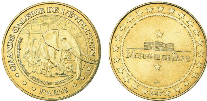
Рис. 28. Медаль із зображенням експозиції Великої галереї еволюції. Аверс та реверс.

У верхній частині аверсу першої з них — зображення Ротонди, домівки для гігантських черепак, нижче — зображення представників тваринного світу (рис. 31). По краю, кружно написи, зверху: «Menagerie du Jardin des Plantes» (Звіринець Саду рослин), знизу: «Muséum