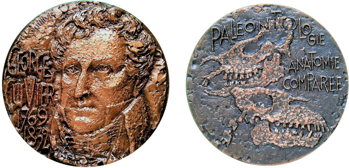
Рис. 17. Французька медаль, присвячена Жоржу Леопольду Кюв'є. Аверс та реверс.