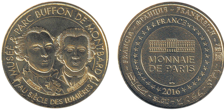
Рис. 14. Медаль із зображенням Луї Жан-Марі Добантона. Аверс та реверс.

Fig. 14. Medal with the image of Louis Jean-Marie Daubenton. Obverse and reverse.