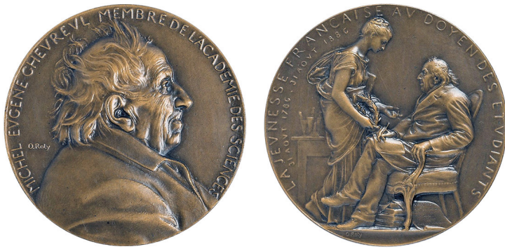
Рис. 19. Французька медаль, присвячена Мішелю Ежену Шеврелю. Аверс та реверс.