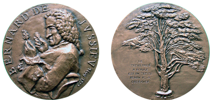
Рис. 7. Медаль 1983 р., присвячена Бернару де Жюссє. Аверс та реверс.

Fig. 6. Medal dedicated to Bernard de Jussieu. Obverse and reverse.