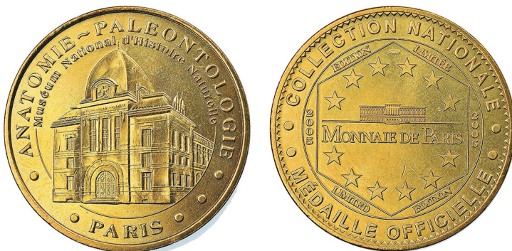
Рис. 29. Медаль із зображенням Палеонтологічного музею. Аверс та реверс.