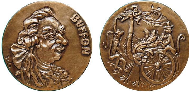
Рис. 9. Медаль 1955 р., присвячена графу де Бюффону. Аверс та реверс. Фото В. Барштейна з оригіналу.