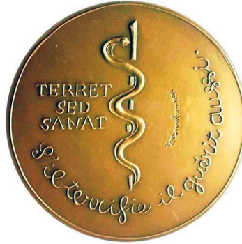
Рис. 4. Медаль на честь П'єра Ширака. Аверс та реверс.

Fig. 4. Medal in honour of Pierre Chirac. Obverse and reverse.