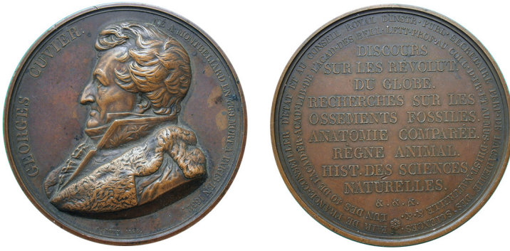
Рис. 16. Медаль 1834 року, присвячена Жоржу Леопольду Кюв'є. Аверс та реверс.