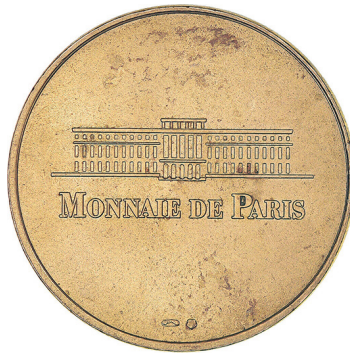
Рис. 33. Медаль, присвячена Венсенському зоопарку (1). Аверс та реверс.