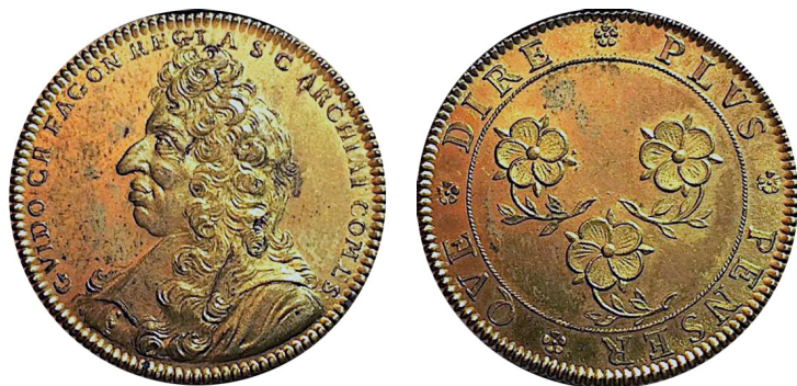
Рис. 2. Жетон на честь Гі Кресана Фагона. Аверс та реверс. Фото: https://www.cgbfr.com/

Fig. 1. Medal in honour of the 300th anniversary of the Royal Garden of Medicinal Plants. Obverse and reverse. V. Barshteyn's photo of the original.