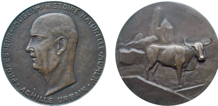
Рис. 23. Медаль, присвячена Ахіллу Джозефу Урбену. Аверс та реверс.

Fig. 22. Medal dedicated to the update of the Museum's exhibition. Obverse and reverse.