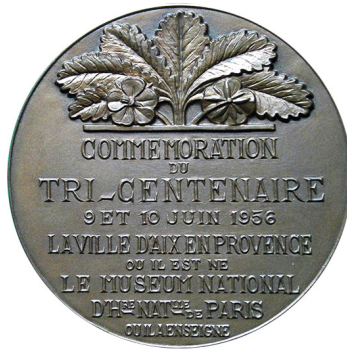
Рис. 3. Медаль до 300-річчя Жозефа Піттона де Турнефора. Аверс та реверс.

Fig. 3. Medal for the 300th anniversary of Joseph Pitton de Tournefort. Obverse and reverse.