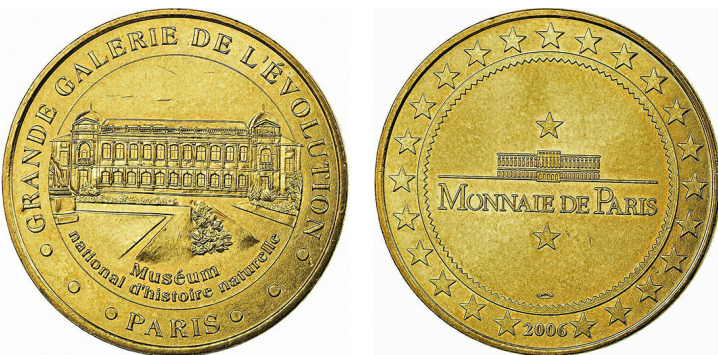
Рис. 27. Медаль із зображенням Великої галереї еволюції. Аверс та реверс.