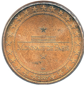
Рис. 30. Медаль, присвячена Галереї палеонтології. Аверс та реверс.