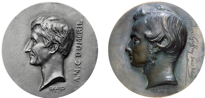
Рис. 21. Медалі, присвячені А. М. К. Дюмерілю та І. Жоффруа Сент-Ілеру.