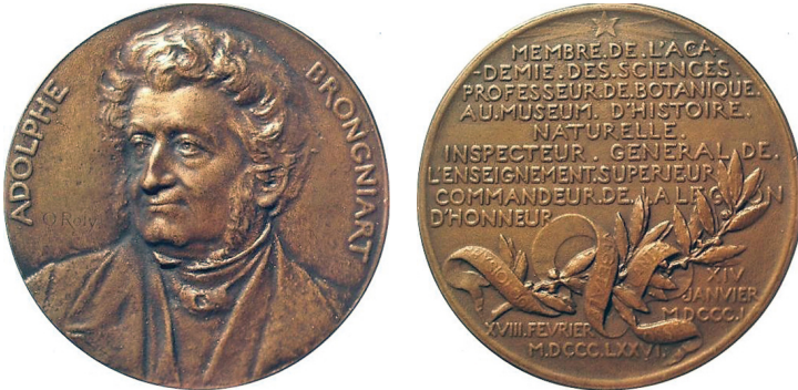
Рис. 20. Медаль, присвячена Адольфу Теодору Броньяру. Аверс та реверс.