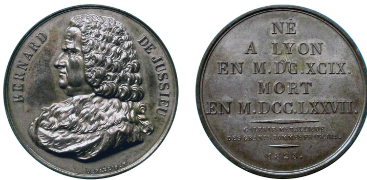
Рис. 6. Медаль, присвячена Бернару де Жюссє. Аверс та реверс.

Fig. 5. Medal in honour of the family of botanists de Jussieu. Obverse and reverse.