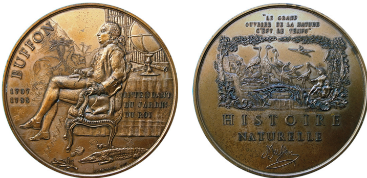
Рис. 10. Медаль 1976 р., присвячена графу де Бюффону. Аверс та реверс.