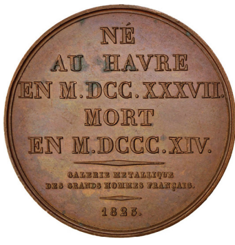
Рис. 13. Медаль, присвячена Бернардену де Сен-П'єру. Аверс та реверс.