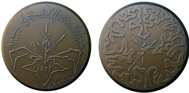
Рис. 26. Французька медаль, присвячена Саду рослин. Аверс та реверс.

Велика галерея еволюції створена з колишньої галереї зоології, є виставковим простором, який зосереджується на еволюції видів і різноманітності живого світу та базується на сучасній сценографії природничих колекцій Музею. Представлено вимерлі види та види, які знаходяться під загрозою зникнення. Підвал призначений для тимчасових виставок.