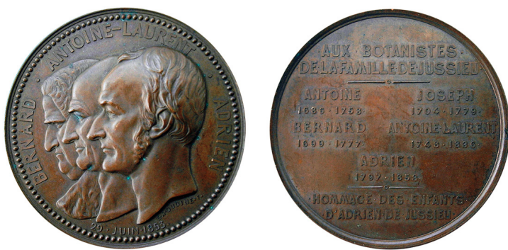
Рис. 5. Медаль на честь сім'ї ботаніків де Жюссє. Аверс та реверс.

Fig. 5. Medal in honour of the family of botanists de Jussieu. Obverse and reverse.