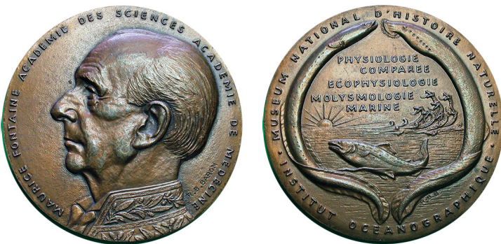
Рис. 24. Медаль, присвячена Морісу Альфреду Фонтену. Аверс та реверс.

Fig. 23. Medal dedicated to Achille Joseph Urbain. Obverse and reverse.