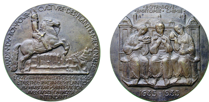
Рис. 1. Медаль на честь 300-річчя Королівського саду рослин. Аверс та реверс.

Fig. 1. Medal in honour of the 300th anniversary of the Royal Garden of Medicinal Plants. Obverse and reverse.