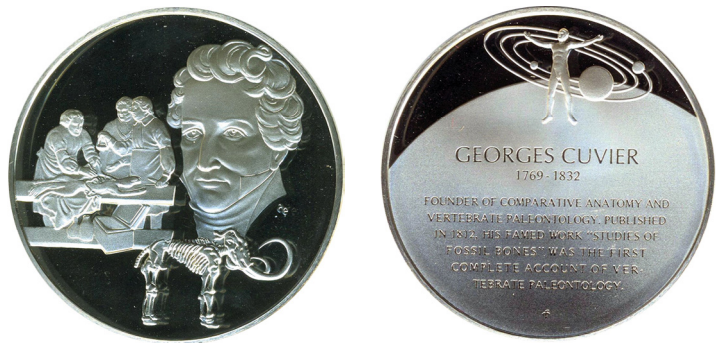
Рис. 18. Медаль США, присвячена Жоржу Леопольду Кюв'є. Аверс та реверс.