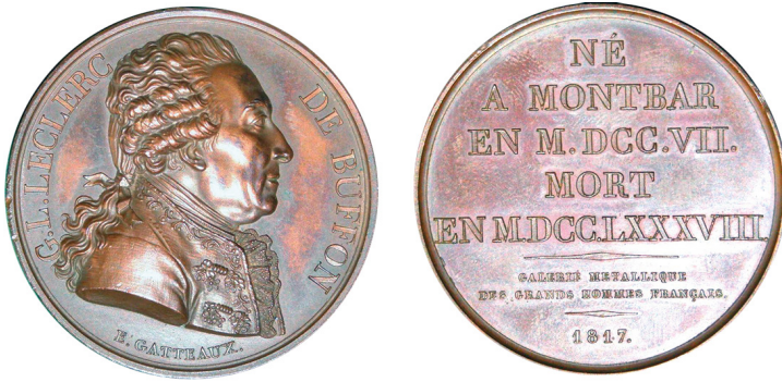
Рис. 8. Медаль 1817 р. на честь графа де Бюффона. Аверс та реверс.