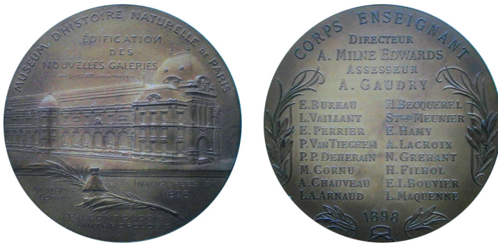
Рис. 22. Медаль, присвячена оновленню експозиції Музею. Аверс та реверс.

Fig. 22. Medal dedicated to the update of the Museum's exhibition. Obverse and reverse.