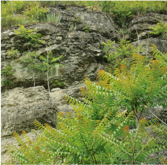
Рис. 3. Інвазія Ailanthus altissima (Mill.) Swingle в каньйоні р. Смотрич біля с. Зубрівка Кам'янець-Подільського району.